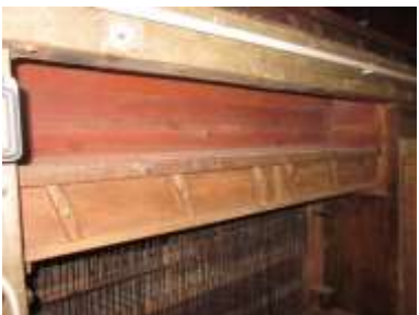
Somierino Oboe allo smontaggio