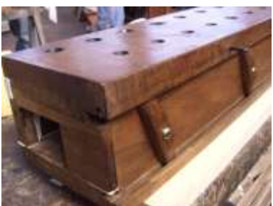
Somierino Oboe in restauro