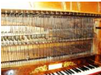
Meccaniche consolle dopo