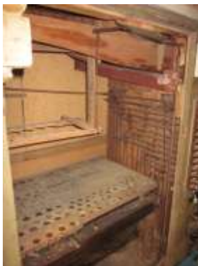
Vista allo smontaggio