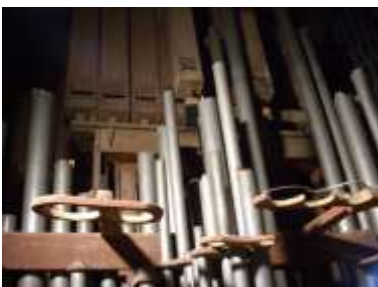
Canne Grand'organo allo smontaggio

Sono inoltre presenti i CAMPANELLI formati da 34 coppette in ottone.