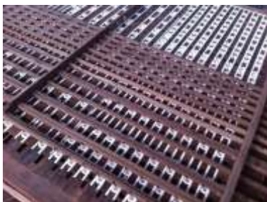
Particolare durante il restauro