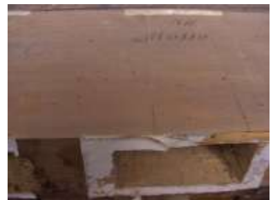
Mosso (provincia di Biella)