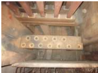
Somiere Bassi armonici allo smontaggio