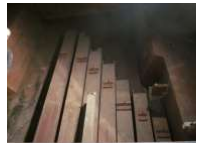
Contrabassi allo smontaggio