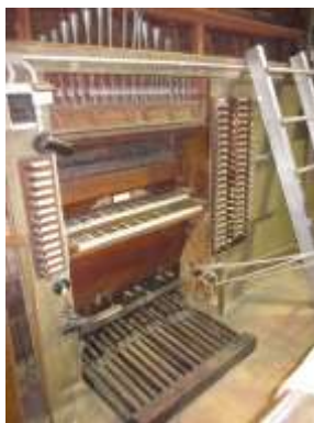
Consolle allo smontaggio

In vari punti delle pannellature della consolle sono presenti bruciature causate dalle candele utilizzate in passato per l’illuminazione.