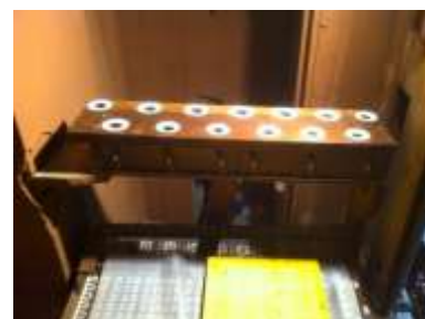
Somiere Timballi al rimontaggio