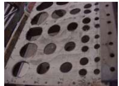
Crivello Ripieno Ped. in restauro