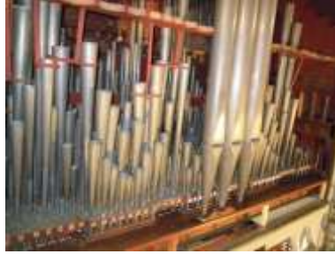
Grand'organo con anze ricollocate