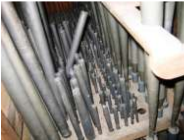
Canne Eco allo smontaggio