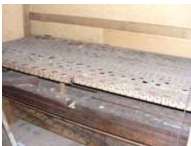
Somiere eco allo smontaggio