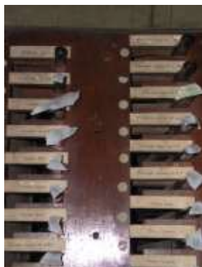
Manette grand'organo e cartellini prima

Analogamente il FLAUTO IN OTTAVA INTIERO sfrutta dal Do1 al Sol#9 le medesime canne dell'OTTAVA BASSI.