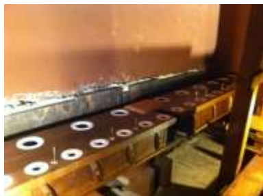
Somieri Contrabassi ricollocati