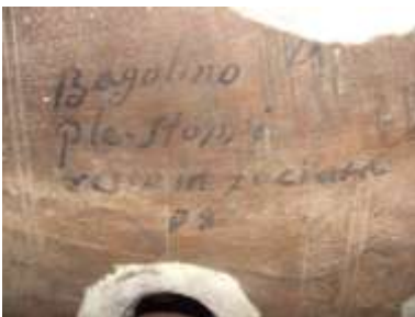
Bagolino (provincia di Brescia)

Sui vari somieri ed elementi dello strumento si leggono varie scritte a china indicanti luoghi diversi da Stradella ove sono riscontrabili strumenti dei Serassi; tali scritte testimoniano come modifiche e ripensamenti fossero comuni nella costruzione di un organo e come spesso elementi già realizzati e destinati venissero utilizzati per accelerare la consegna di altri.