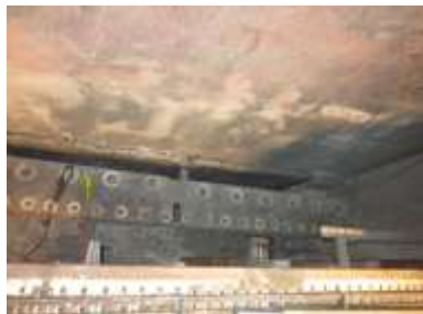
Somieri Contrabassi allo smontaggio

OSSERVAZIONI CIRCA I SOMIERI SECONDARI: Tutti realizzati in noce tranne i pavimenti delle segrete e ventilabri che sono in abete; quello dei TROMBONI 12' presenta due alti "zoccoli" superiori in abete ove sono alloggiati i piedi delle canne ad ancia. I due somieri relativi al TUONO sono in realtà la parte terminale di 2 canali portavento con i fori superiori per l'alimentazione delle canne e un singolo grande ventilabro ciascuno con antina frontale di ispezione in noce con 2 farfalle rivettate ciascuno. Gli altri sono del tipo ad aria libera con valvola a tampone, ventilabri analoghi ai somieri maggiori.