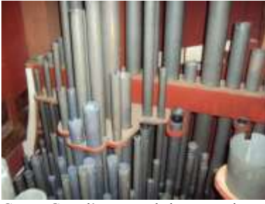
Canne Grand'organo al rimontaggio