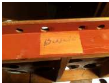
Busseto (provincia di Parma)

Sulla coperta del somiere dei Contrabassi primi al Bi si legge: Contrabassi al Bi Su quella dei Bassi armonici si legge: armonici Schorta Su quella dell'Oboe si legge: oboe Stradella