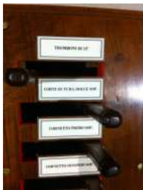
Manette dopo e cartellini nuovi