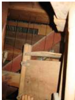
Retro cassa prima