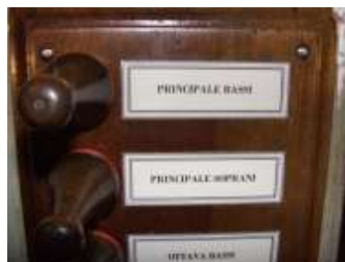
Pomoli Eco dopo