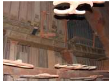
Corni e Ripieno Ped. allo smontaggio