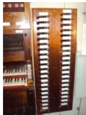
Tavola registri dopo