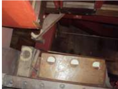
Somierini Tuono al rimontaggio

CRIVELLI: Sono presenti 4 crivelli tutti realizzati analogamente per Grand'organo, Eco espressivo, Ripieno al pedale e Oboe soprani.