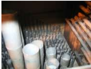
Canne Eco allo smontaggio