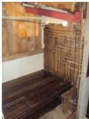
Vista al rimontaggio