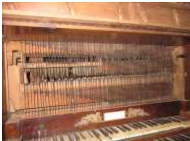
Meccaniche consolle prima del restauro