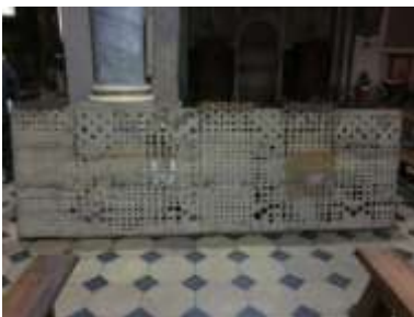
Crivello Grand'organo allo smontaggio

I cartellini attuali, con la numerazione progressiva dei canali, sono riconducibili al Lingiardi e vennero incollati sopra agli originali Serassi ancora visibili al di sotto di questi.