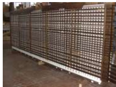
Somiere in attesa del ricollocamento