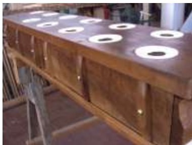
Somiere Bassi armonici in restauro