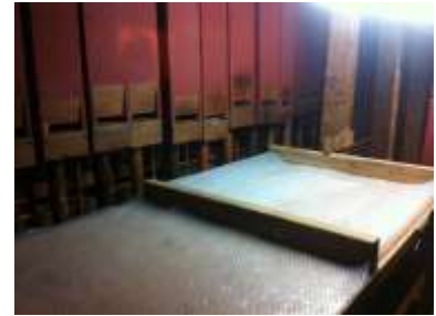
Mantice interno al rimontaggio