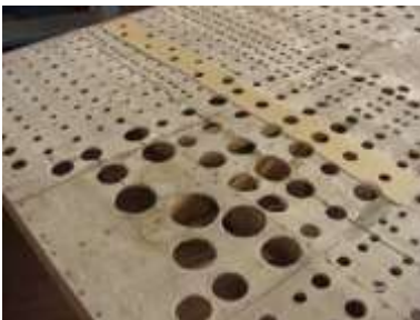
Crivello Grand'organo restaurato