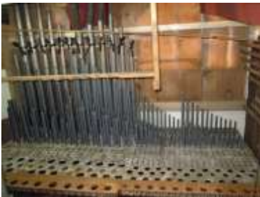
Eco in fase di rimontaggio