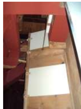
Retro cassa dopo

DISPOSIZIONE DA SX SECONDO LA NUMERAZIONE MODERNA: 26 – 13 – 28 – 15 – 30 – 17 – 32 – 19 – 34 – 21 – 36 – 23 – 25 – 14 – 27 – 16 – 29 – 18 – 31 – 20 – 33 – 22 – 35 – 24 – 37 – 39 – 41 – 43 – 45 – 47 – 49 – 51 – 53 – 55 – 38 – 40 – 42 – 44 – 46 – 48 – 50 – 52 – 54 – 56 – 57 – 58.