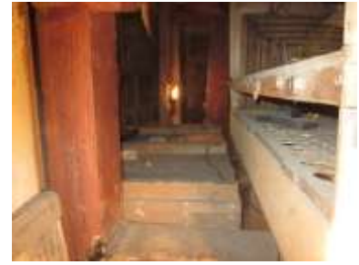
Mantice interno allo smontaggio