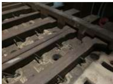
Particolare allo smontaggio