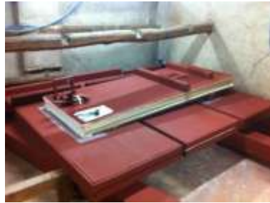
Mantici a Sx al rimontaggio