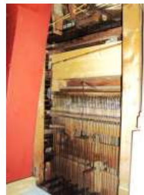
Retro consolle a fine lavori

TASTIERE: 2 tastiere originali da 66 tasti ciascuna con ambito Do-1 - La58.