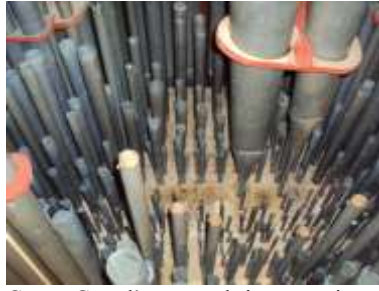
Canne Grand'organo al rimontaggio