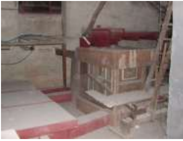
Stanza mantici e azion. man. Prima