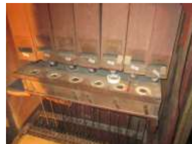
Somiere Timballi allo smontaggio