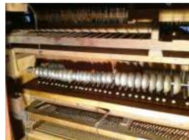
Campanelli in fase di rimontaggio

CATENACCIATURE: Quella del grand'organo è rivolta verso l'interno con strangoli in ottone a doppia spira e presenta fili di consueta fattura con piega fissa, segnature a china e tracciate a secco; quella dell'eco espressivo è rivolta verso l'esterno ed analoga alla precedente ma la regolazione avviene mediante dadi in cuoio avvitati su fili filettati.