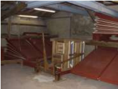
Mantici in funzione a fine lavori

NUMERO CANNE E TIPOLOGIA: Lo strumento conta di un totale di 2336 canne sonore e 14 finte nelle facciate laterali.