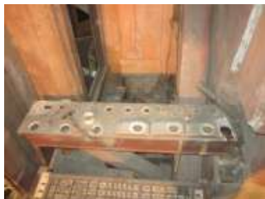
Somiere Ple 16' allo smontaggio