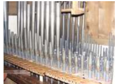
Eco in fase di rimontaggio alle anze