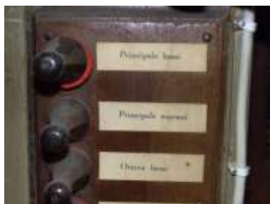
Pomoli Eco prima