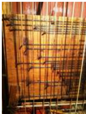
Catenacciatura registri dopo