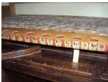
Particolare eco al rimontaggio