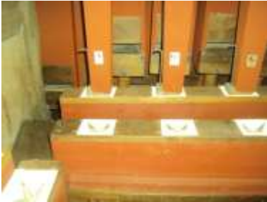
Somiere Tromboni al rimontaggio