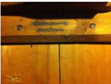
Ocimiano (provincia di Alessandria)