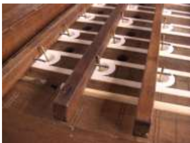
Particolare durante il restauro