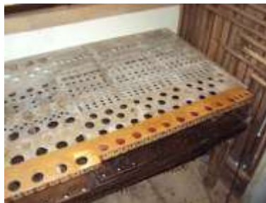
Crivello Eco ricollocato