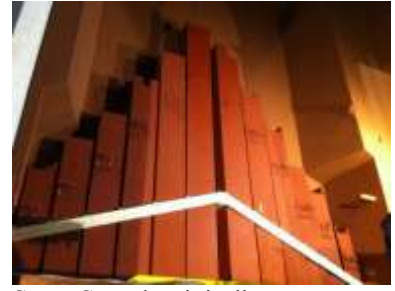
Canne Contrabassi ricollocate