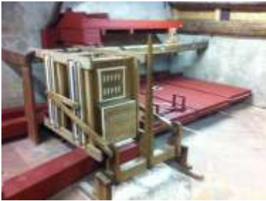
Azionamento man. e mantici a Dx dopo