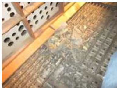
Particolare allo smontaggio

La guarnizione delle punte dei ventilabrini è affidata a borsini in pelle a calotta negativa incollati su asette in noce con fori circolari.