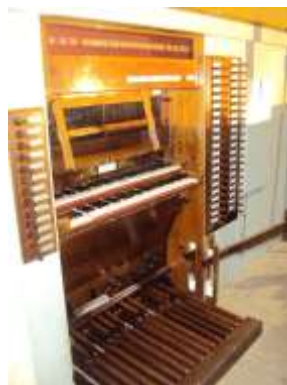
Consolle durante il rimontaggio