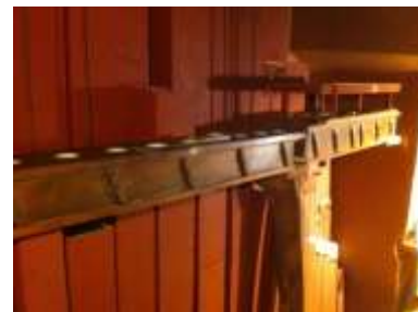
Corni e Ripieno Ped. al rimontaggio