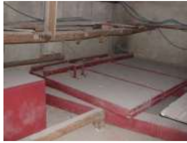
Mantici a Sx prima