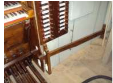
Pedaloni Grand'organo dopo

PEDALONI: A sinistra della pedaliera è presente il pedalone con incastro relativo al Tiraripieno dell'eco espressivo con il quale si montano i primi 7 pomoli superiori quindi dal Principale bassi alla Sesquialtera.