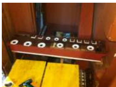
Somiere Ple 16' al rimontaggio