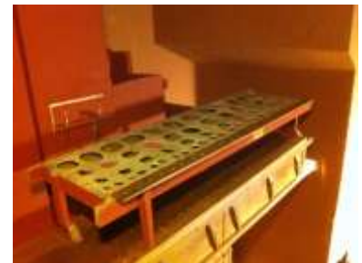
Crivello Ripieno Ped. ricollocato

MANTICERIA: Lo strumento è alimentato da 7 mantici del tipo "cuneo" posti all'interno di una grande stanza nel sottotetto della chiesa e posta più in alto rispetto alla cantoria; sono presenti altri 2 mantici analoghi ma accantonati dal Lingiardi e non ricollocati. Tutti hanno 6 pieghe e sono originali Serassi ma 4 di questi, leggermente più piccoli, sono settecenteschi mentre gli altri, leggermente più grandi, sono ottocenteschi.