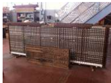
I 2 somieri principali "a confronto"