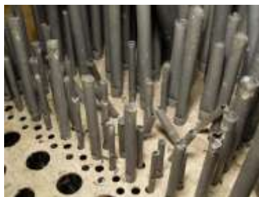
Danni al canneggio