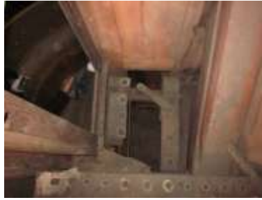
Somierini Tuono allo smontaggio