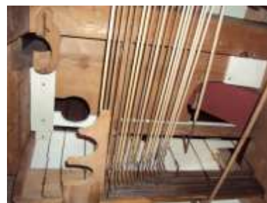
Particolare soffitto cassa riassembleto