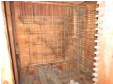
Catenacciatura registri prima