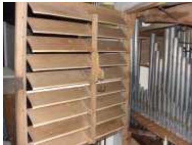
Gelosie restaurate e ricollocate