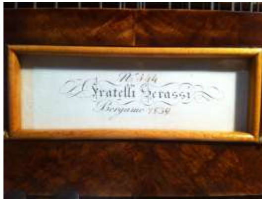
Cartellino originale, dopo il restauro, al centro dell'assetta superiore alla tastiera

ATTESTAZIONE DELLA PATERNITA': La paternità è attestata dal cartiglio sopra la tastiera, protetto da vetro.