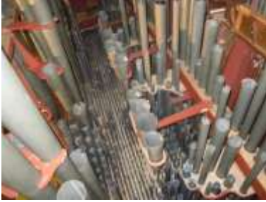
Canne a Grand'organo terminato